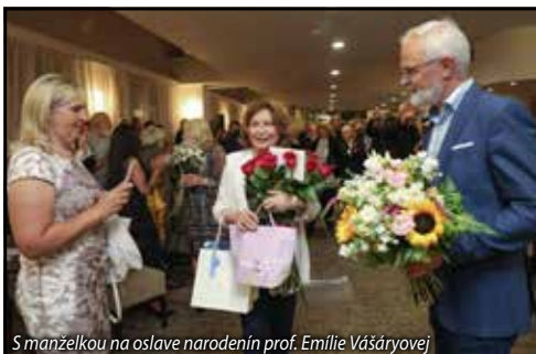
S manželkou na oslave narodenín prof. Emílie Vášáryovej