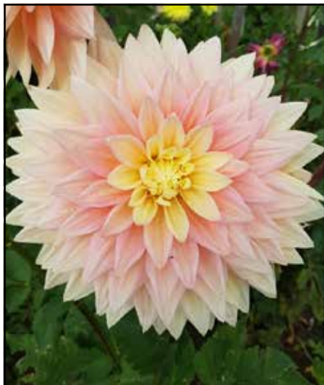
Semenáč 28/20 – něžně světlorůžová barva se žlutým středem se barevně nepodobá žádné naší jiřince, možná tvarem květu připomíná odrůdu Wanda s Aurora. Rostlina roste bujně, její výška je 170 – 200 cm, je mohutná se silnými stonky s pevnými obřími květy s pevným květenstvím o průměru 20 – 25 cm. Považujeme ho za náš nejlepší semenáč.