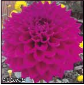
A C Cowlitz