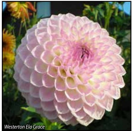
Westerton Ela Grace