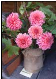
Semenáč 22/20 – jedním z rodičů byla patrně odrůda Mingus Toni, ale naše růžové květy s tmavě růžovým žháním jsou sytější a kvalitnější