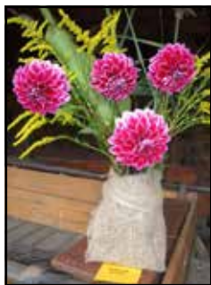
Semenáč 60/20 je rovněž podobný typům Caballero a Maxime, ale barva je jiná - fialová s bílými okraji